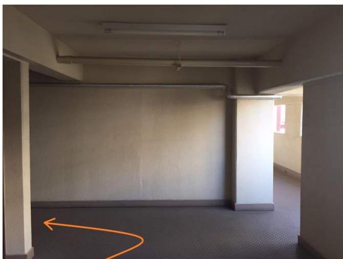
⑧降りたら、左に曲がります。