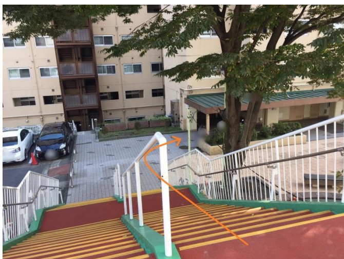
⑥下ったら、右手のエレベーターホールへ