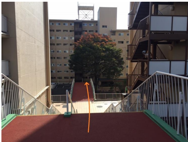
⑤真っ直ぐに階段を下ります。